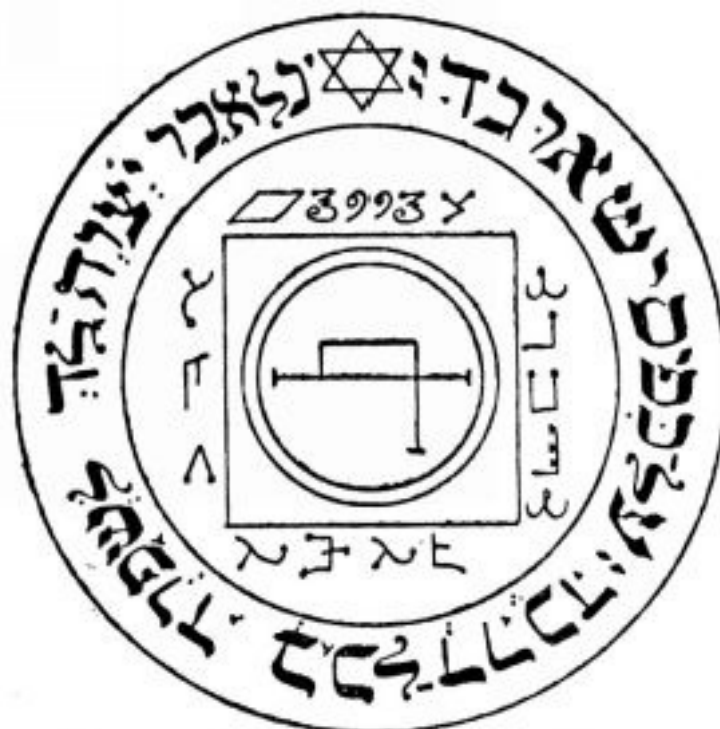
PANTÁCULO ⊕ D ⊕ S ⊕ L

Outro pantáculo indicado para entrar em sintonia com os espíritos do Sol, mas com um detalhe. Este pantáculo ajuda a desenvolver a levitação. Pode consagrá-lo da mesma forma que o pantáculo de Metatron e trazê-lo junto consigo num saquinho dourado. Cole o pantáculo num papel duro e num papel laminado dourado no verso com o seu nome (tanto o nome verdadeiro quanto mágico).