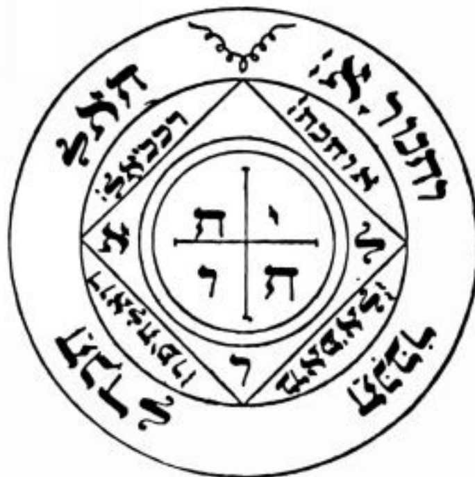
PANTÁCULO ⊕ DE SATURN ⊕

Este pantáculo é indicado para aqueles que temem ficar presos em algum lugar, desde um elevador até uma prisão de verdade. Também ajuda a sair de lugares ou situações complicadas, mas num sentido de fuga (em suma, ele te ajuda a sair correndo de alguma coisa complicada demais para resolver agora, mesmo que isso não resolva a situação em questão). Consagre-o em hora do Sol e deixe sete dias no altar com uma pena de pássaro e uma chave sobre ele. Nesse período, deixe uma vela de sete dias acesa (amarela ou branca) e depois de passado o período indicado, coloque o pantáculo, a pena e a chave num saquinho dourado e ande sempre com ele.