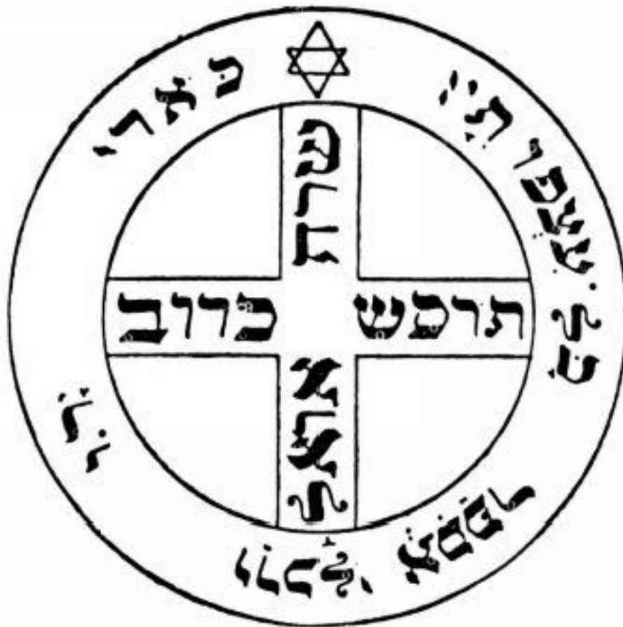
PANTÁCULO ⊕ DE JÚPITER

Sob a proteção do anjo Michael, este pantáculo protege contra todo tipo de perigo. Deve ser consagrado na hora de Júpiter, num domingo e levado sempre consigo num saquinho preto.