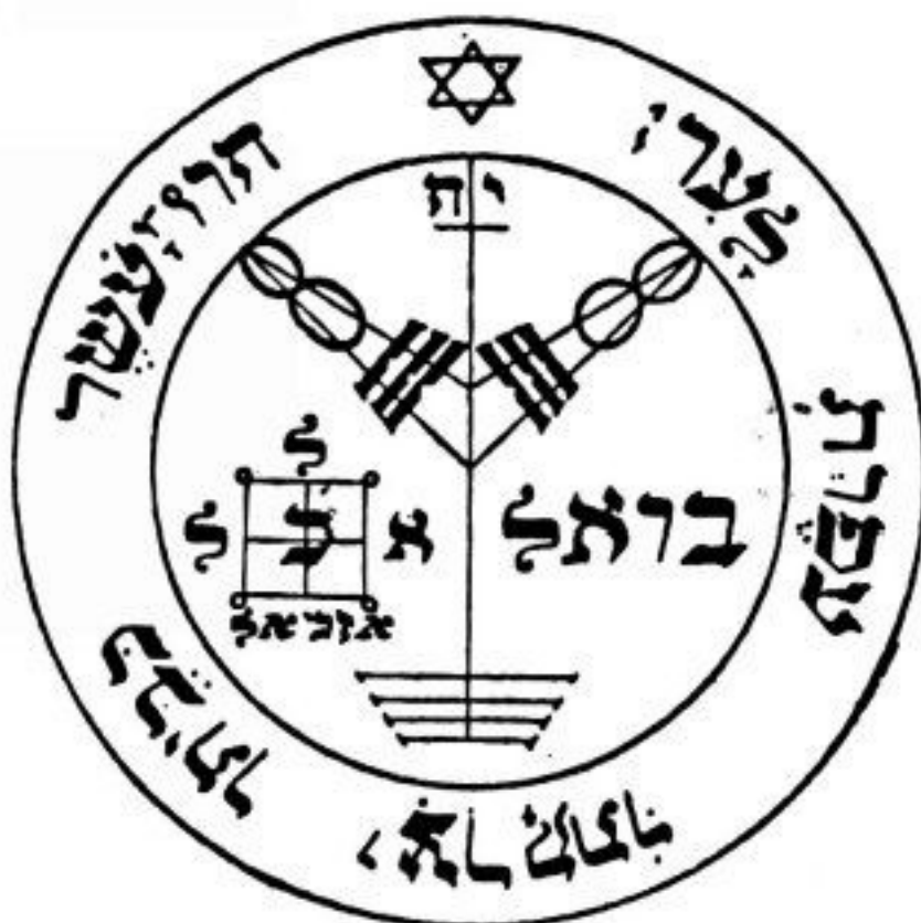
PANTÁCULO ⊕ DE JÚPITER

Este pantáculo confere riquezas e honrarias e está sob a proteção do anjo Bariel. Deve ser consagrado numa hora de Júpiter e deixado no altar com algum objeto de prata, uma vela prata e algumas moedas prateadas. Depois que a vela queimar, coloca-se o pantáculo num saquinho prateado com as moedas e leva-se sempre consigo.