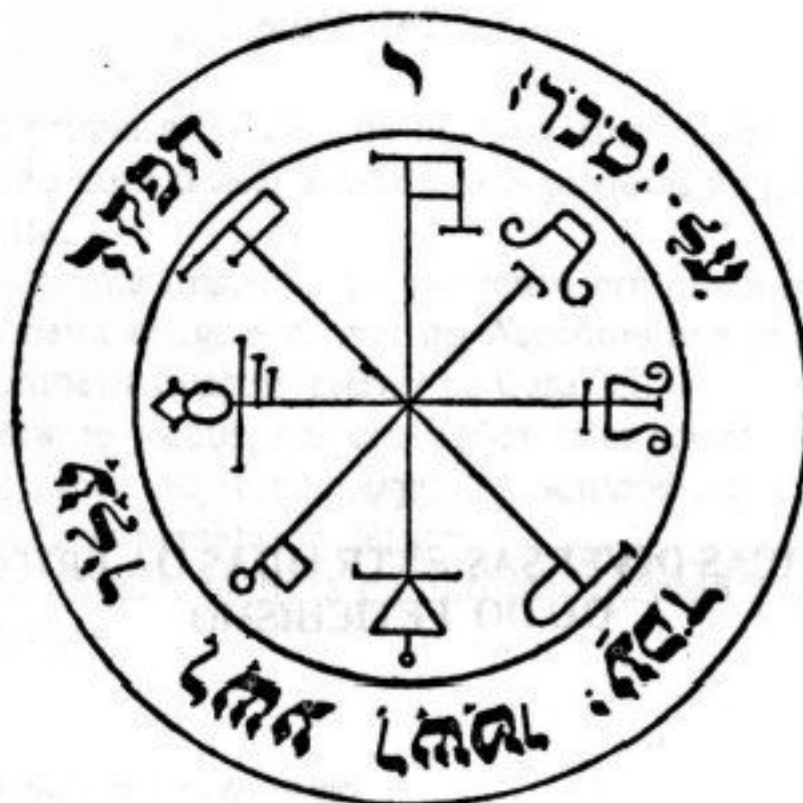
PANTÁCULO ⊕ DE SATURNO ⊕

Pantáculo de proteção contra espíritos e obsessões. Deve ser consagrado numa hora de Saturno e deixado em um lugar seguro com foto ou nome da pessoa a ser protegida. No caso de proteção de uma casa ou estabelecimento, deve ser colocado no alto do batente da porta de entrada.