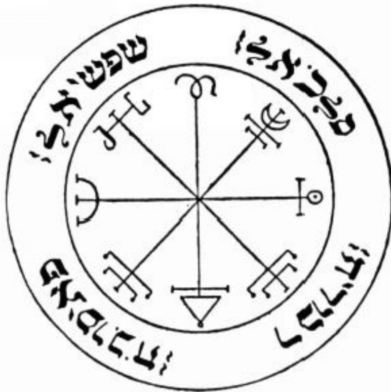
PANTÁCULO ⊕ DE SATURNO ⊕

Pantáculo que serve para invocar os espíritos de Saturno. Em volta do círculo, lê-se em hebraico os nomes das potestades a ele dedicadas: Omliel, Anachiel, Araukiah e Anazachia. Deve ser consagrado numa hora de Saturno e deixado no altar até que se conquiste o objetivo almejado.