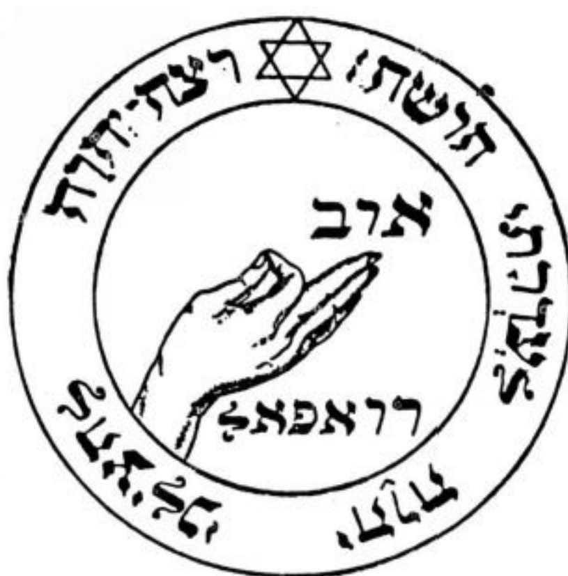
PANTÁCULO ⊕ DA LUA

Além de servir para atrair os espíritos da Lua, este pantáculo protege contra os perigos da água. Deve ser consagrado numa hora da Lua e levado consigo nas viagens por mar ou durante as cerimônias da Lua.