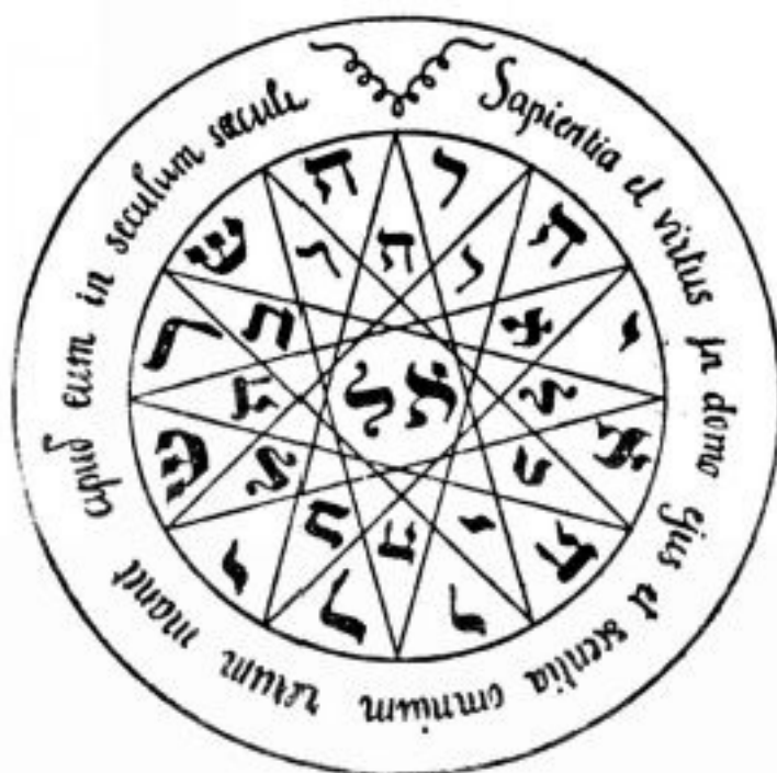
PANTÁCULO DE MERCÚRIO

Pantáculo indicado para quem quer ampliar faculdades psíquicas ou mentais. Para quem está trabalhando o poder da mente (de telecinese à programação mental) ou para quem está estudando ou tentando aprender uma coisa nova, esse pantáculo é de grande ajuda pois trabalha com os espíritos de Mercúrio. Deve ser consagrado na hora de Mercúrio e desenhado em papel virgem, como os outros pantáculos. Deve ser deixado dentro do livro que se estuda e debaixo do travesseiro quando se dorme. Bom pantáculo para vestibulandos ou pessoas que estejam enfrentando falhas de memória, esquecimento, fadiga mental e coisas assim.