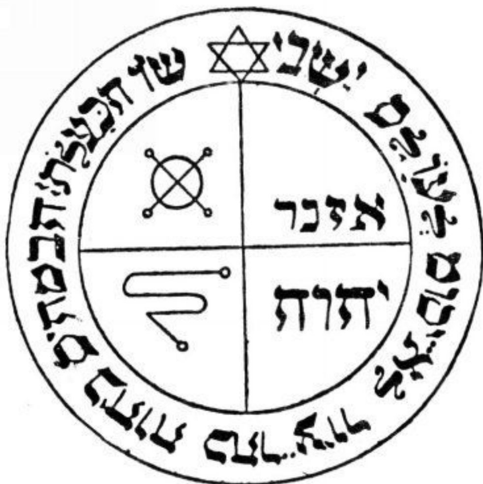
PANTÁCULO ⊕ DE JÚPITER

Pantáculo protetor nas cerimônias de Júpiter. Deve estar junto com o mago durante a operação.