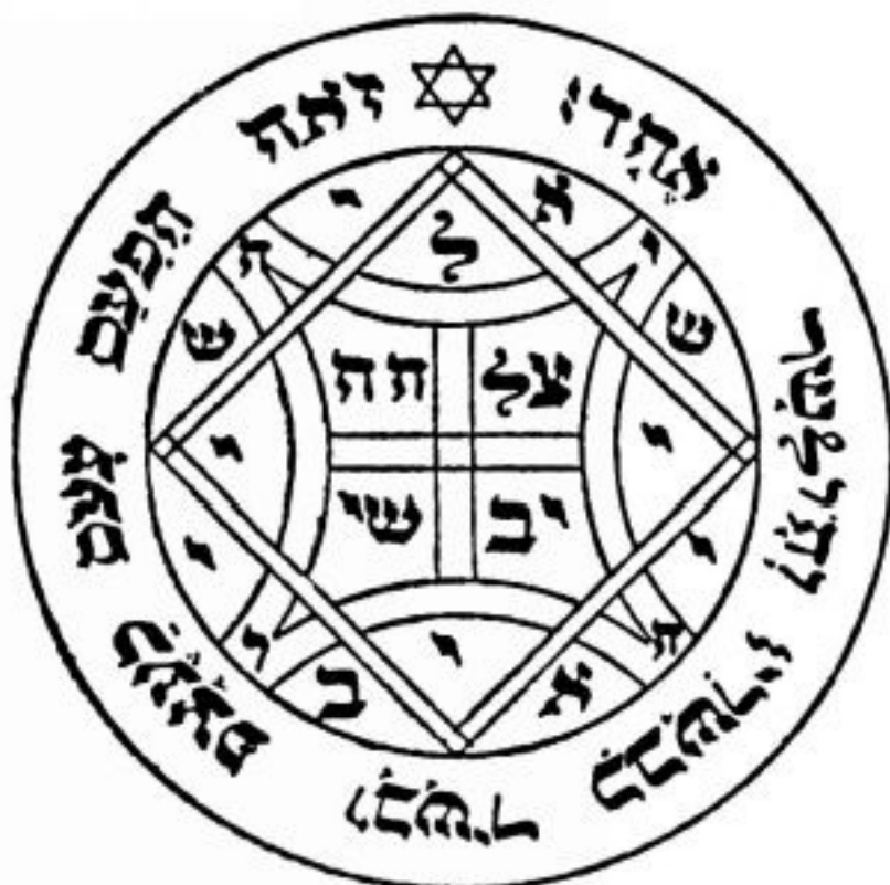
PANTÁCULO ⊕ DE VÊNUS

Este é um pantáculo que protege contra espíritos malignos. É ideal para quem está trabalhando em lugares carregados e habitados por espíritos desocupados e/ou raivosos. Deve-se consagrá-lo na hora de Vênus e deixá-lo no seu altar com uma vela branca e um incenso, dentro do seu caldeirão, com sal grosso. Depois de três dias, deve-se levar o pantáculo sempre consigo.