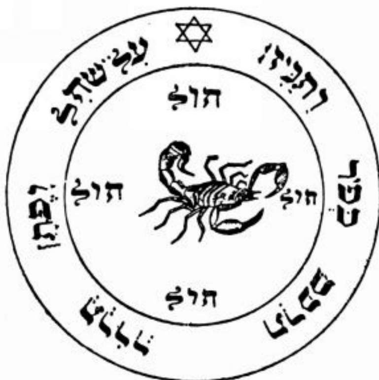
PANTÁCULO ⊕ DE ♀ MARTE

Para batalhas e lutas. Um bom talismã para espíritos guerreiros ou profissões perigosas, como policiais e bombeiros. Ele confere espírito combativo, coragem e impulso. Deve ser consagrado numa hora de Marte e levado consigo num saquinho vermelho. Pessoas que já são encrenqueiras por natureza não devem fazer esse pantáculo, ou correm o risco de chatear a pessoa errada e acabar com um olho roxo, na melhor das hipóteses. Este pantáculo é mais indicado para os lerdos, os espíritos passivos além da conta, pessoas de temperamento indiferente ou muito covardes. Todos temos que encontrar o equilíbrio e ser passivo demais atrapalha tanto quanto ser muito combativo.