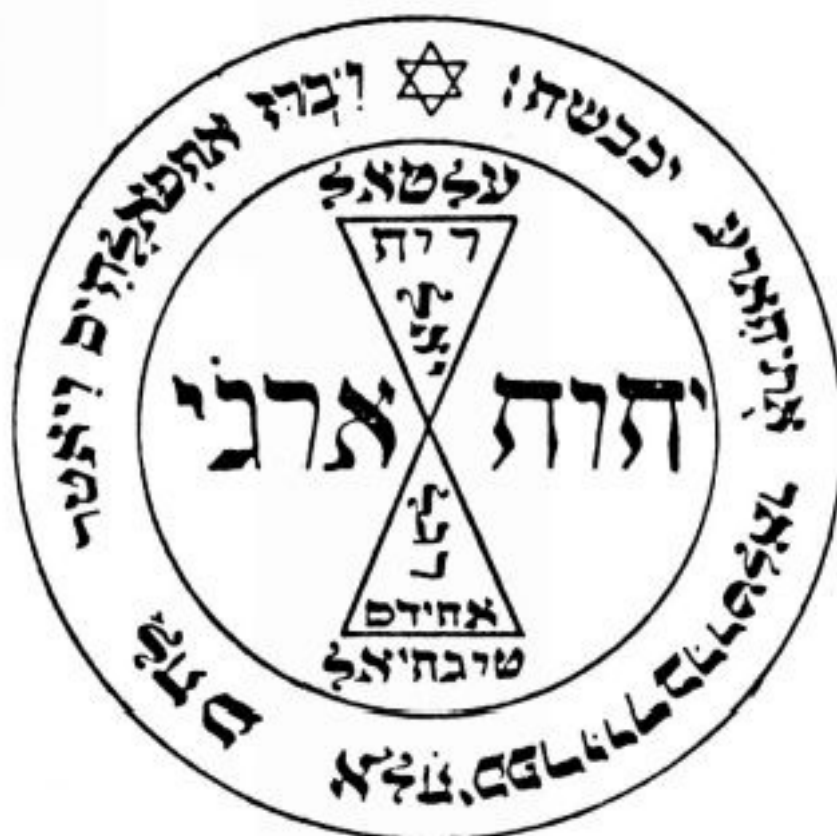
PANTÁCULO ⊕ DE VÊNUS

Este pantáculo confere simpatia e ajuda a conquistar o amor de uma pessoa. Ele é dedicado ao anjo Monachiel e sua Potestade superior é Veralian. Deve ser consagrado naturalmente numa hora de Vênus e deixado num altar coberto com pétalas de rosas, uma vela rosa e um incenso de rosas. Depois, coloca-se num saquinho rosa com as pétalas e um pedaço de canela em pau. Quando sair, leve o saquinho com você.