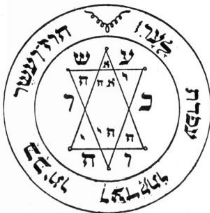
PANTÁCULO DE JÚPITER

Além de proteger contra espíritos malignos durante as cerimônias de Júpiter, este pantáculo confere honra, glória, renome e riquezas. Ele também ajuda a descobrir tesouros. Ele deve ser consagrado numa hora de Júpiter e deixado no altar com uma vela branca, um incenso e algumas moedas de prata. Depois que a vela queimar, deve-se colocar o pantáculo e as moedas num saquinho prata e levá-lo sempre consigo. Pode ser usado em retratos (coloca-se atrás do retrato, por dentro da moldura, se for o caso).