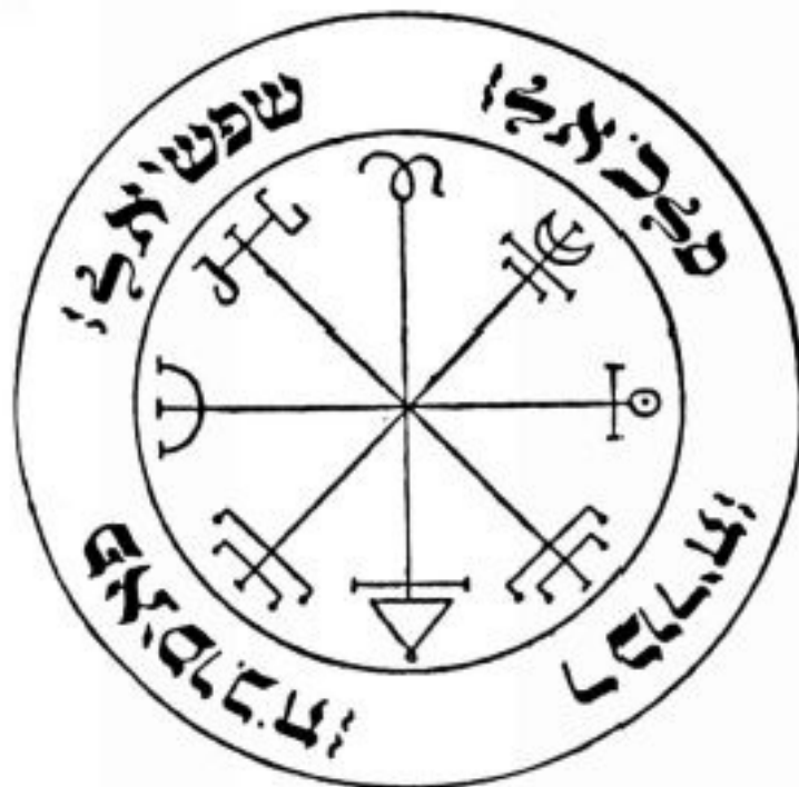
PANTÁCULO ⊕ DE SATURNO ⊕

Outro pantáculo do Sol indicado para sucesso, poder, glória, fama e tudo aquilo que todo mundo sonha. Para músicos, coloque o pantáculo dentro do seu instrumento musical. Para escritores e desenhistas, coloque o pantáculo enrolado na caneta, colado na contracapa do caderno, embaixo da mesa onde se trabalha ou na torre do computador. Proceda como no pantáculo de Metatron, mas lembre-se. Você precisa fazer a sua parte! Ficar parado esperando o sucesso cair do céu não vai ajudar muito.