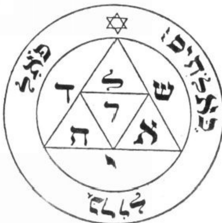
PANTÁCULO ⊕ DE ♀ MARTE

Este pantáculo confere a vitória sobre as ciladas e armadilhas. Ele também protege contra o choque de retorno nos feitiços de ódio (que eu não ensino aqui por razões éticas. Já tem ódio demais no mundo sem a ajuda de pantáculo). Ele deve ser consagrado numa hora de Marte e deixado no altar com seu punhal ou espada durante nove dias. Deve ser levado consigo quando se sentir em perigo e deixado junto com sua espada nos outros momentos.