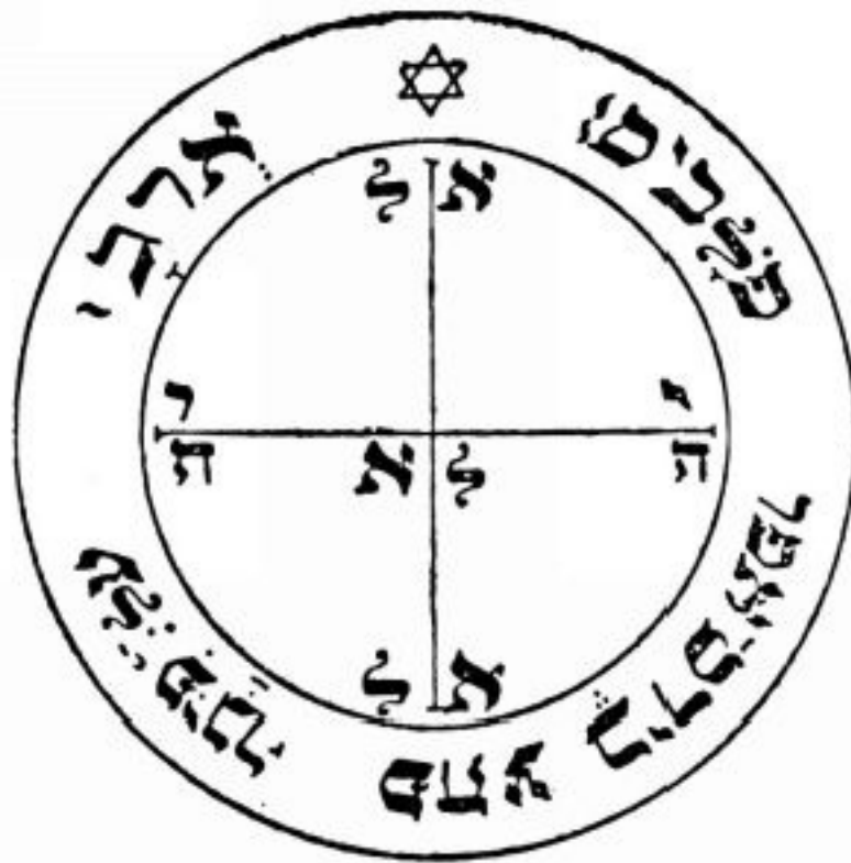
PANTÁCULO DE MARTE

Este pantáculo dá vitórias em combates e processos judiciais, sendo indicado para qualquer pessoa que tenha problemas na justiça ou que trabalhe com a mesma (como advogados e promotores). Deve ser consagrado numa hora de Marte e colocado junto com o processo em disputa. No caso dos que trabalham com a Justiça, o pantáculo deve ser trazido junto consigo num saquinho vermelho com umas folhas de louro.